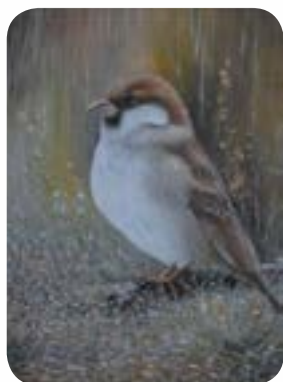
Comme un moineau