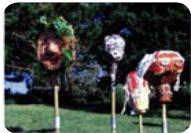
2005 : «Les hommes du monde» au lac Kir de Dijon