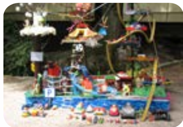
2009 : «Villes imaginaires» aux jardins Darcy et Arqubuse de Dijon