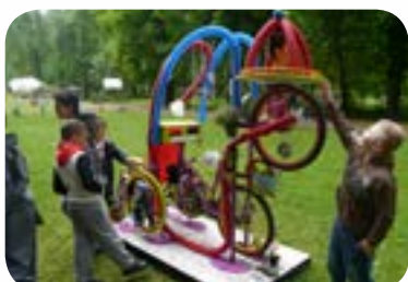
2014 : «Machines Z'Extraordinaires» au Parc de la Colombière de Dijon