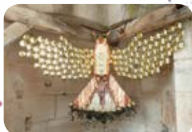
2018 : «Créatures Fantaisites» au Château de Châteauneuf-en-Auxois