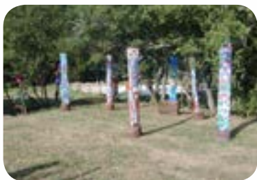
2002 : «Totem» à Nolay