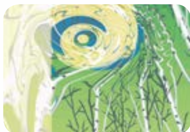
2006 : «Forêt d'Arts» au lac Kir de Dijon