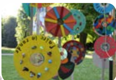
2017 : «L'ART'iculé» au Parc de la Colombière de Dijon