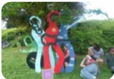
2008 : «Music'Art» au lac Kir de Dijon