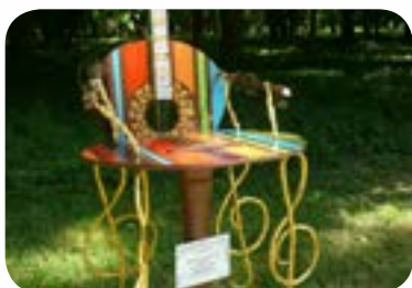
2011 : «D'une rencontre à l'autre» au Parc de la Colombière de Dijon