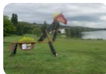
2007 : «Bestiaire» au lac Kir de Dijon