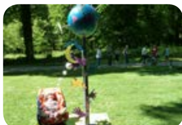
2015 : «Raconte-moi une chanson» au Parc de la Colombière de Dijon