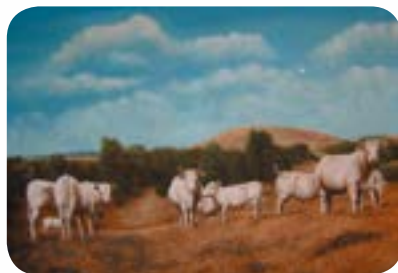
Paturages du charolais