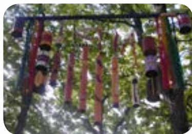
2003 : «Mobiles» à Semur-en-Auxois