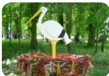
2012 : «D'âme nature» au Parc de la Colombière de Dijon