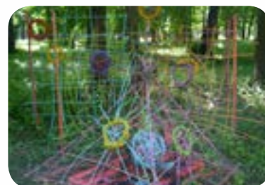
2013 : «Bios-Divers-Cité» au Parc de la Colombière de Dijon