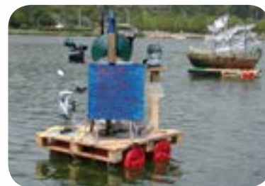
2004 : «Aux berges de l'Art» au lac Kir de Dijon