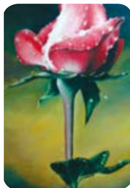
Son altesse la rose