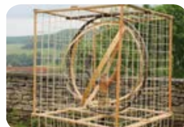
2016 : «Tarabiscofil» au Château de Sainte Colombe-en-Auxois