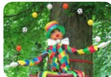
2010 : «Acrob'Art» au Parc de la Colombière de Dijon