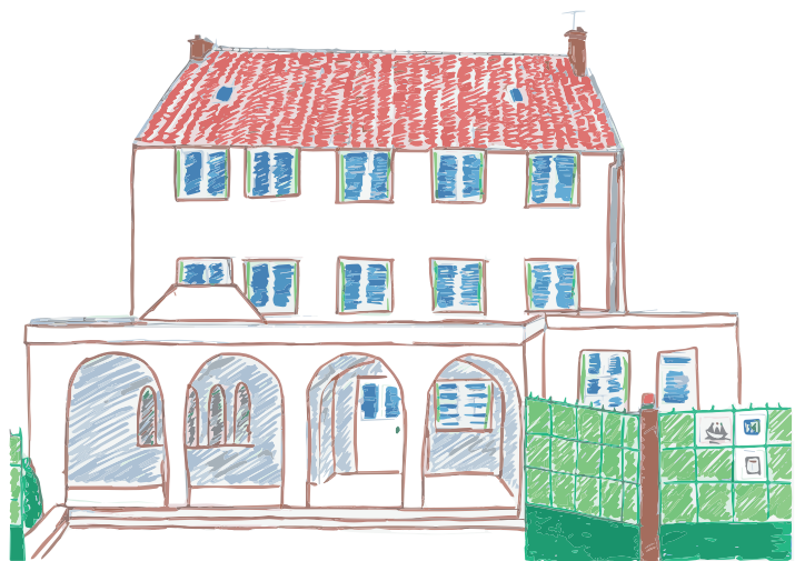
Maison de la Treille

Ce nouveau type d'habitat fait l'objet d'une phase d'expérimentation initiée en 2021 par le Secrétariat d'État chargé des personnes handicapées, avec la mise en place d'une nouvelle aide dédiée à la personne : l' Aide à la Vie Partagée (AVP) .